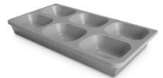
Münzgeldablage passend für Lade 1 oder 2