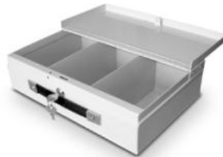
3er Abwurfbox (flach) abschließbar