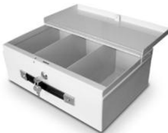
3er Abwurfbox (hoch) abschließbar